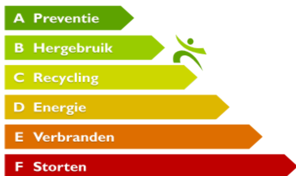
LADDER VAN LANSINK 2.0

Het Rijk, de Vereniging van Nederlandse Gemeenten (VNG) en de afvalbranche vereniging (NVRD) hebben een landelijk afvalscheidingsdoel vastgesteld. Dit is onderdeel van het Rijksbrede programma circulaire economie. Het doel is om in 2020 maximaal 100 kilogram restafval per persoon te hebben. Het doel voor 2025 is scherper en ligt op maximaal 30 kilogram restafval per persoon per jaar. Minder restafval is goed. Er wordt dan immers meer afval gescheiden aangeboden. Dat gescheiden ingezamelde afval kan gerecycled en opnieuw ingezet worden. Of, er is in zijn totaliteit minder afval door preventie. Dat is milieutechnisch nog beter. Preventie staat immers bovenaan de ladder van Lansink. Deze ladder loopt van storten (laagste trede), naar verbranden, sorteren en recyclen, hergebruik en tot slot naar het hoogst haalbare, preventie. De ladder is in het Landelijk Afvalbeheer Plan verder verfijnd (zie onderstaand kader).