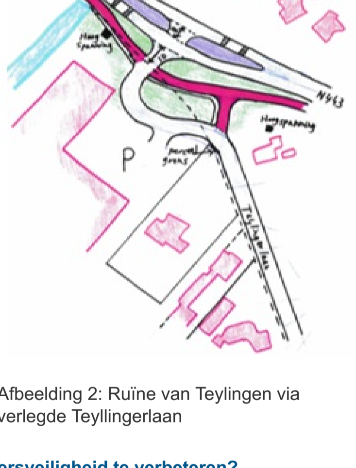
Afbeelding 2: Ruïne van Teylingen via verlegde Teylingerlaan