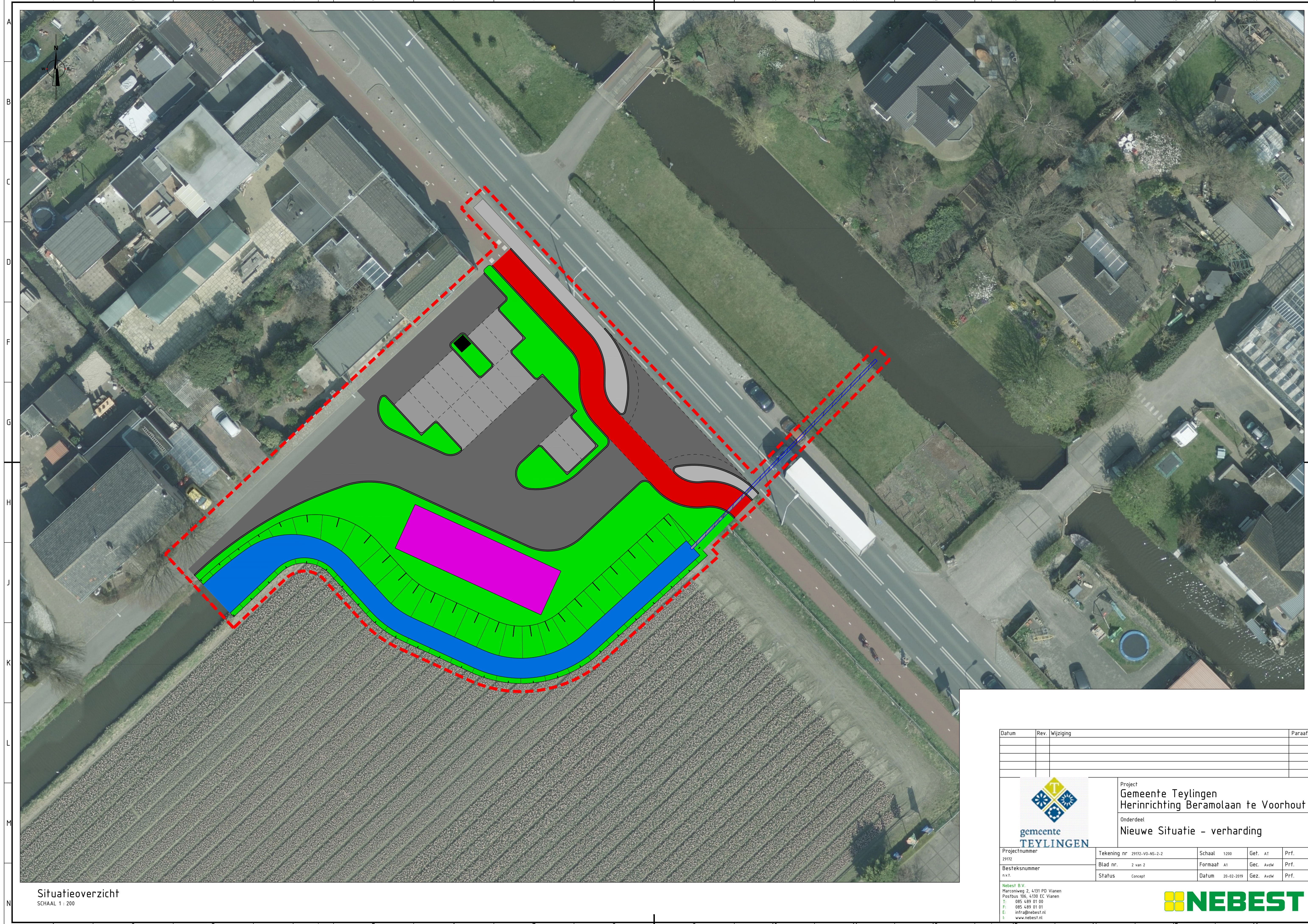
Situatieoverzicht SCHAAL 1 : 200